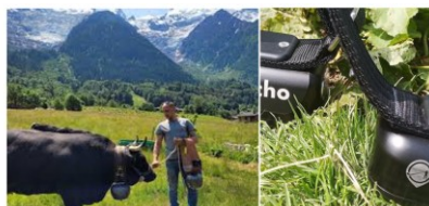
Lauréat 2024 qui s'est bien développé !